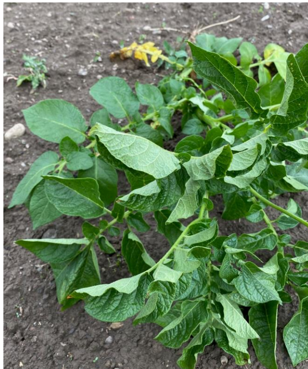
Primärinfektion Blattroll Agria 10. Juni 2020 Die unteren Blätter sind gesund und die oberen krank.

Freundliche Grüsse, SEMAG, Saat- und Pflanzgut AG Adrian Krähenbühl